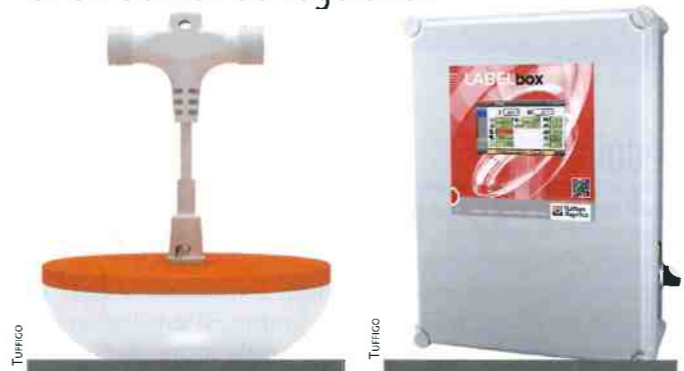
▲ LA FORME ET LA RÉPARTITION DES LEDS DE PULSA homogénéisent le flux lumineux.