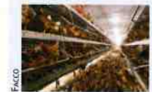
Hall 10, allée B, stand 30.

Facco présente deux modèles de la ligne Volière Natura, l'un pour poules, l'autre en poussinière. Ces solutions ont été étudiées pour permettre l'élevage avec un très haut niveau de qualité de vie des animaux tout en obtenant des performances similaires aux installations en cages.