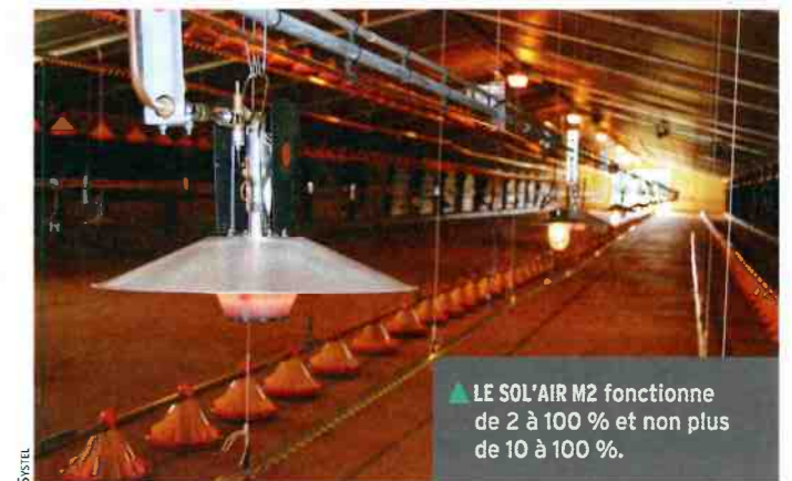
▲ LE SOL'AIR M2 fonctionne de 2 à 100 % et non plus de 10 à 100 %.

gardant les mêmes propriétés de répartition et de diffusion de chaleur du Sol'air traditionnel, le Sol'air M2 travaille de 2 à 100 % (et plus de 10 à 100 %) grâce à l'ajout d'un détendeur et d'une veilleuse. Celle-ci n'utilise que 120 W/h, soit une consommation de 10 g/h, ce qui représente une économie de 70 g/h lorsque ce dernier fonctionne au minimum. ■