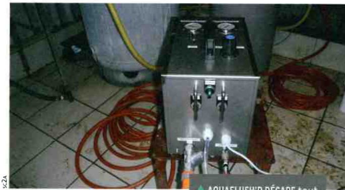
▲ AQUAFLUSH'R DÉCAPE tout type de canalisation.

En présence du lot ou lors du vide, les experts de SC2A nettoient vos canalisations partout en France, à l'aide de l'Aquaflush'r. Cet équipement de décapage, par pression d'air et d'eau en alternance, fonctionne sur tout type de matériel d'abreuvement. Avec le soutien d'une caméra endoscopique, l'équipe de SC2A