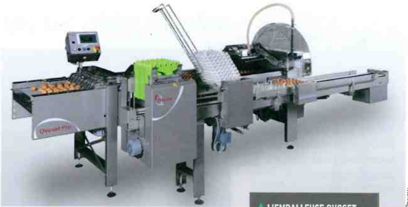
▲ L'EMBALLEUSE OVOVET PRO offre une capacité d'exploitation de 30 000 œufs par heure.

sont facilement accessibles pour le nettoyage et la maintenance. Elle se combine à la calibreuse Ovograder qui peut être réglée pour sélectionner des fourchettes de poids spécifiques. La gamme PSCP, offrant une machine au bon rapport qualité-prix pour la sélection et le compartimentage