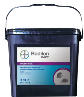
Rats et Souris